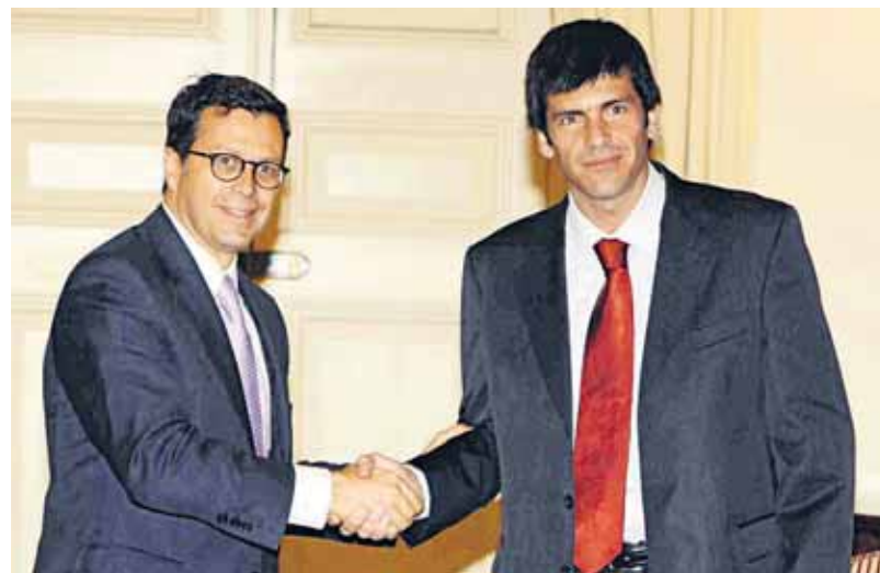
El ministro del Interior presentó esta mañana al nuevo director de la Agencia Nacional de Inteligencia (ANI).